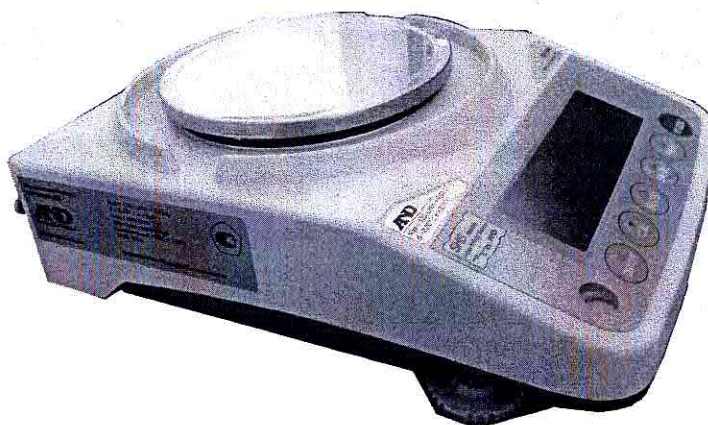
Рисунок 1 – Общий вид весов неавтоматического действия DX.

Принцип действия весов основан на использовании электромагнитной компенсации. Сила тяжести объекта измерений вызывает смещение чувствительного элемента из положения, соответствующего нулевой нагрузке. Это смещение компенсируется с помощью электромагнитной силы, возвращающей чувствительный элемент в положение, соответствующее нулевой нагрузке. Электрический сигнал, соответствующий этой электромагнитной силе и пропорциональный массе объекта измерений подвергается аналого-цифровому преобразованию, математической обработке электронными устройствами весов с дальнейшим определением значения массы объекта измерений.