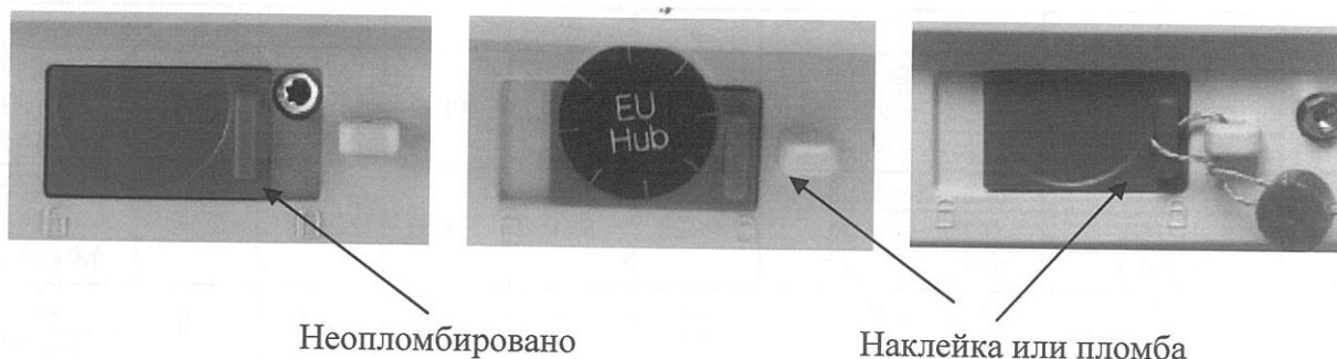
Рис. 3 Схема пломбировки от несанкционированного доступа

Схема пломбировки весов от несанкционированного доступа приведена на рис. 3.