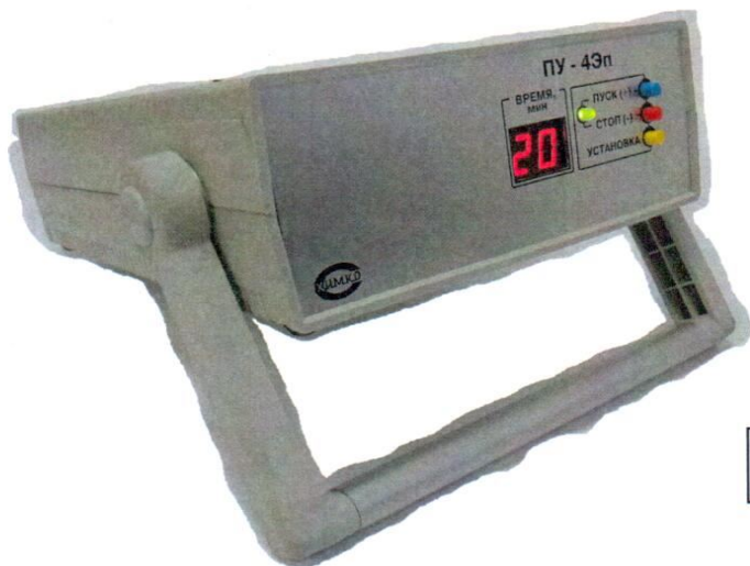
Рисунок - 15 Аспиратор ПУ-4Эп