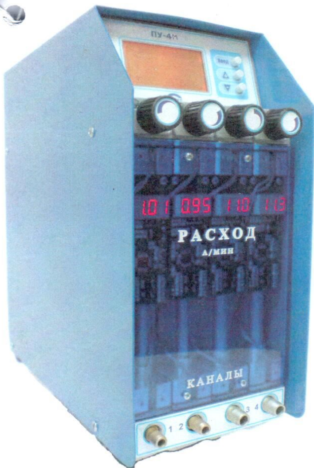
Рисунок 13 - Аспиратор ПУ-4М ПУ-4М исп.1