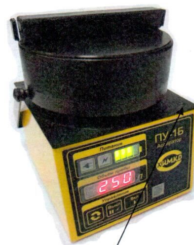
Разрушающаяся при вскрытии наклейка