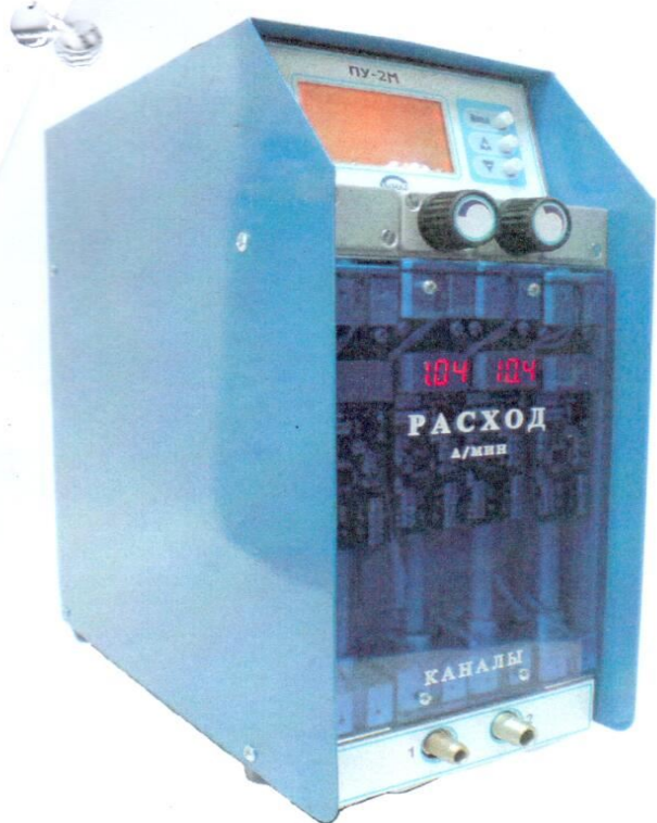
Рисунок 5 - Аспиратор ПУ-2М, ПУ-2М исп.1