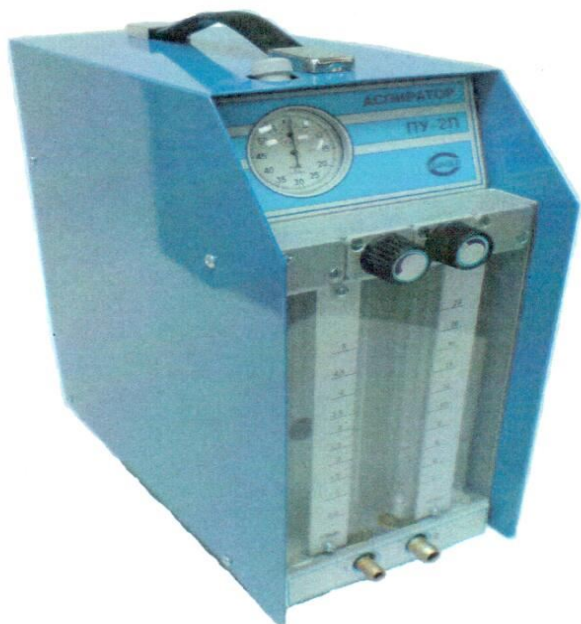
Рисунок 7 - Аспиратор ПУ-2П, ПУ-2П исп.1