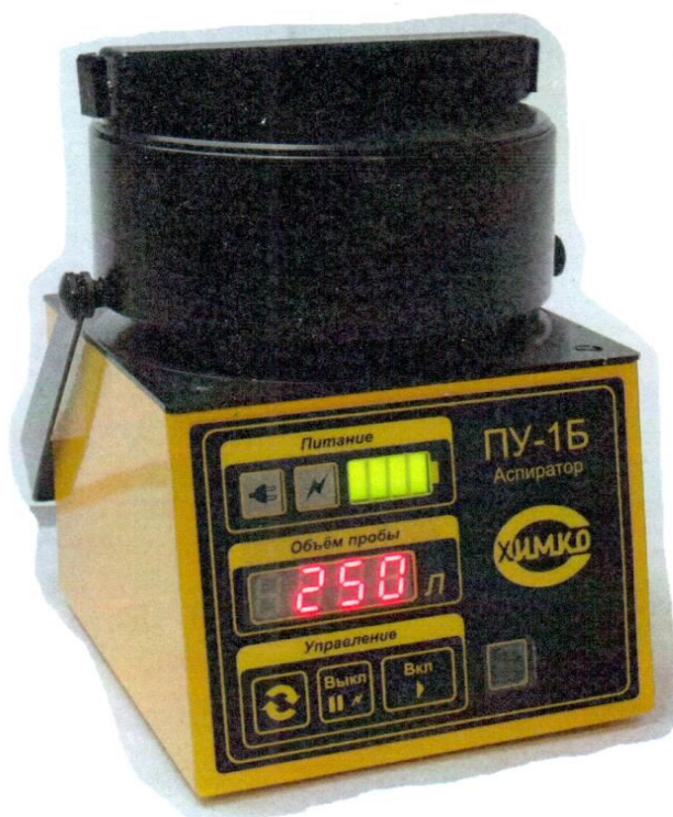
Рисунок 17 - Аспиратор ПУ-1Б, ПУ-1Б исп.1