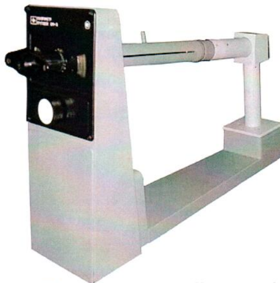
Рисунок 1 - Общий вид поляриметра кругового СМ-3