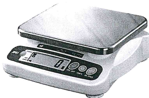
Рисунок 1 – Общий вид весов NP

Весы снабжены следующими устройствами (в скобках указаны соответствующие пункты ГОСТ OIML R 76-1-2011):